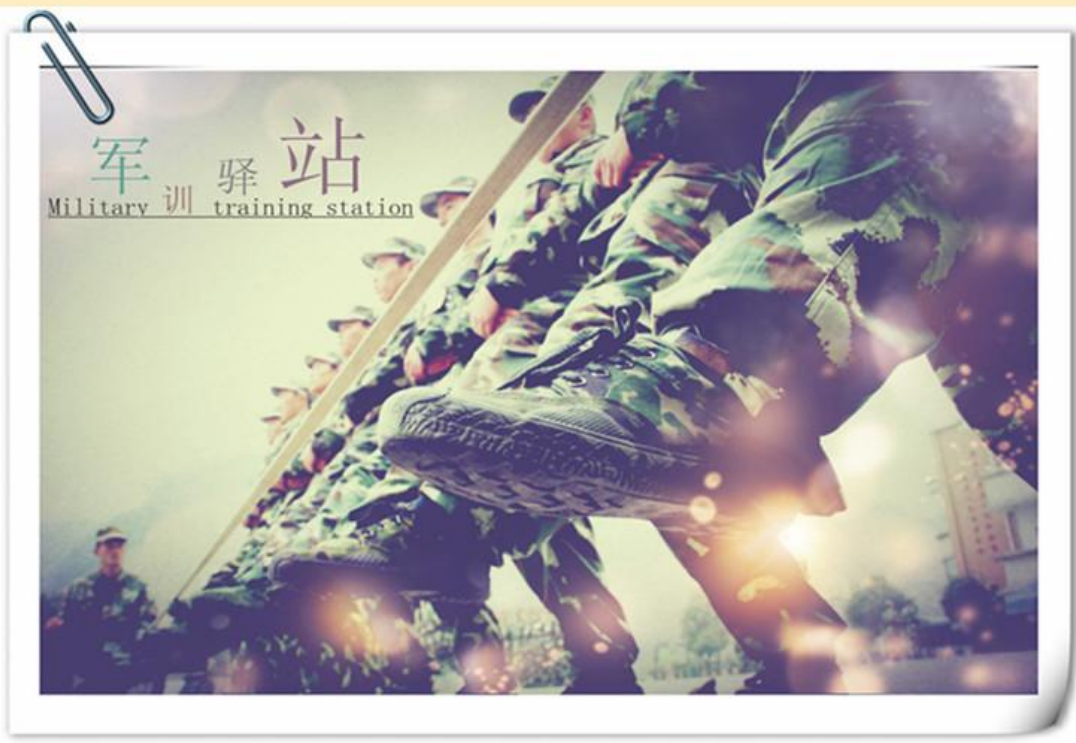
军 驿 站 Military 训 training station